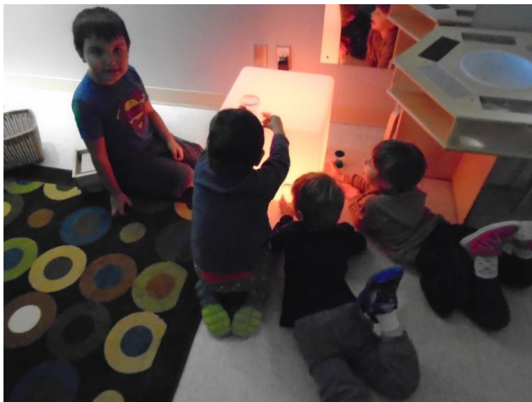
Nouveauté... cube de lumière! Les amis sont tellement excités de découvrir le cube de lumière!