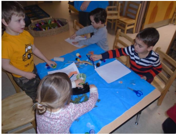
Créativité sans bornes! Papiers, ruban gommé, ciseaux, bâtons de popsicle, pompons, etc...