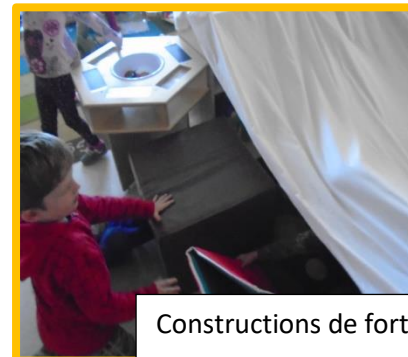
Constructions de fort