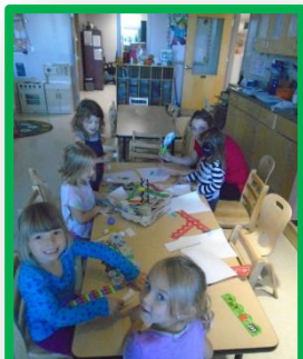
Bricolage avec bordures