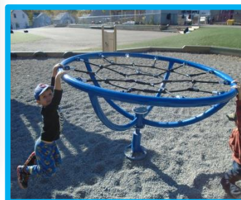
On joue dehors