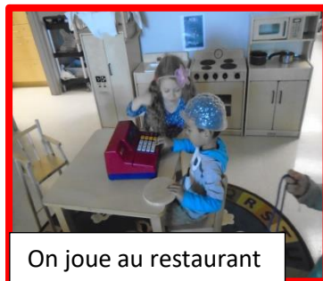
On joue au restaurant