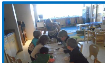
On s'amuse avec la crème à raser