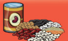
Légumineuses cuites 175 mL (¾ tasse)