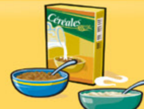
Céréales Froides : 30 g Chaudes : 175 mL (¾ tasse)