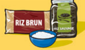
Riz, boulgour ou quinoa, cuit 125 mL (½ tasse)