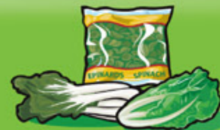
Légumes feuillus Cuits : 125 mL (½ tasse) Crus : 250 mL (1 tasse)