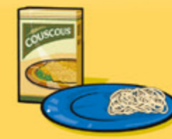
Pâtes alimentaires ou couscous, cuits 125 mL (½ tasse)