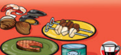
Poissons, fruits de mer, volailles et viandes maigres, cuits 75 g (2 ½ oz)/125 mL (½ tasse)