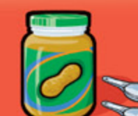
Beurre d'arachide ou de noix 30 mL (2 c. à table)