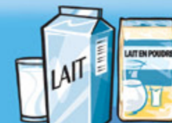
Lait ou lait en poudre (reconstitué) 250 mL (1 tasse)