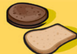
Pain 1 tranche (35 g)