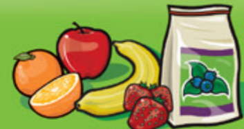
Fruits frais, surgelés ou en conserve 1 fruit ou 125 mL (½ tasse)