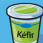
Kéfir 175 g (¾ tasse)