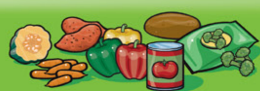
Légumes frais, surgelés ou en conserve 125 mL (½ tasse)