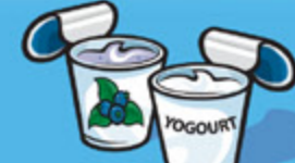
Yogourt 175 g (¾ tasse)