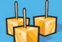
Fromage 50 g (1 ½ oz)