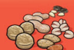
Noix et graines écalées 60 mL (¼ tasse)

Le tableau ci-dessus indique le nombre de portions du Guide alimentaire dont vous avez besoin chaque jour dans chacun des quatre groupes alimentaires.