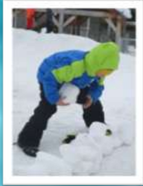
Ici, mes amis construisent un fort avec des boules de neige. Beaux travail d'équipe!