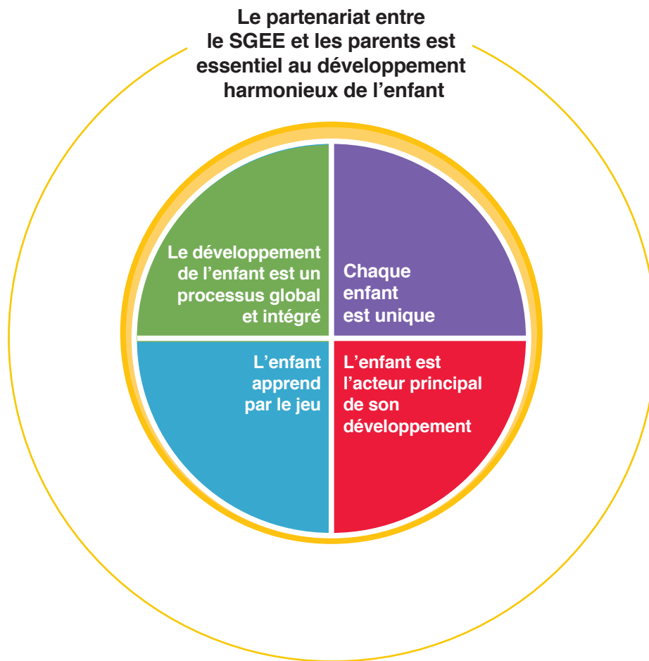
Figure 3 – Les principes de base